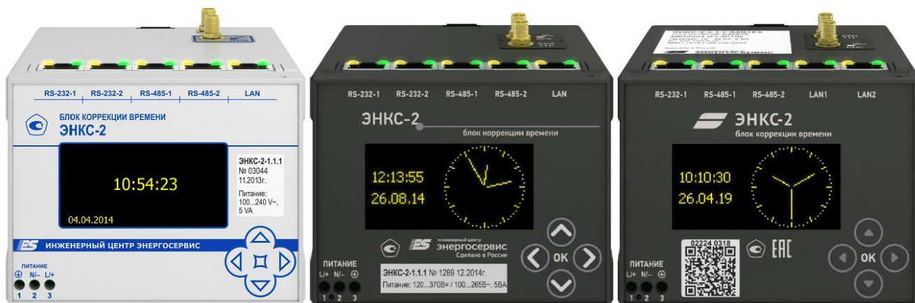
Рисунок 1 – Общий вид БКВ